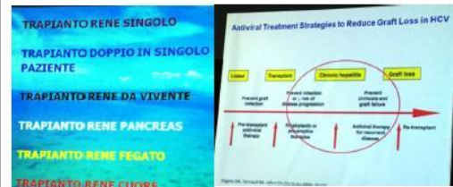
Il sorriso nella relazione medico paziente